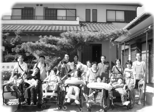
大地の家★民宿体験