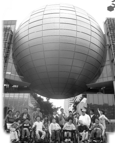
紙風船★名古屋市科学館