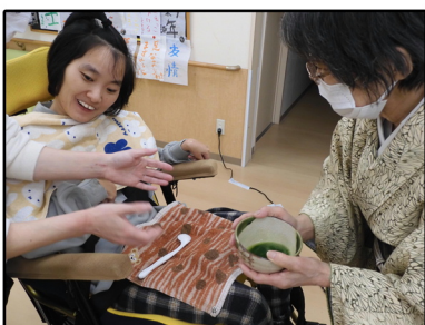
↑ 初釜(抹茶にチャレンジ)