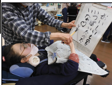
↑ 書初め(今年の抱負)

外に出る機会を増やし、室内だけでは味わうことのできない季節そのものをメンバーとともに実感していきたいと思います。