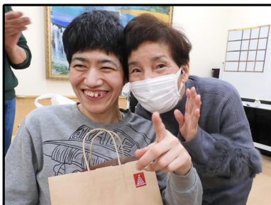
↑ クリスマス週間に母と ↓