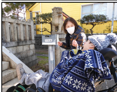
↑ 初詣に地域の神社へ